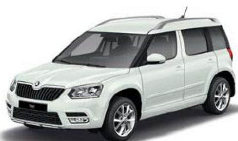
Laser White uni*