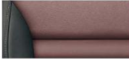
Ambition interior* Terracotta leather/artificial leather