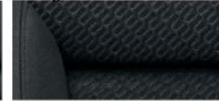
Elegance interior – Yeti Outdoor Black fabric