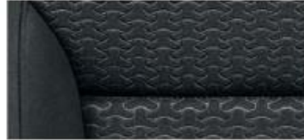
Elegance interior – Yeti Black fabric