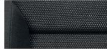
Ambition interior – Yeti Outdoor Black fabric