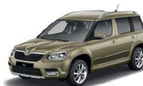
Jungle Green metallic