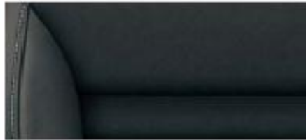
Ambition, Elegance interior* Black Alcantara/leather/artificial leather