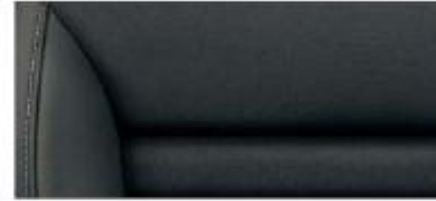
Ambition, Elegance interior* Black leather/artificial leather