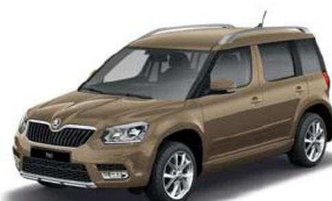
Mato Brown metallic