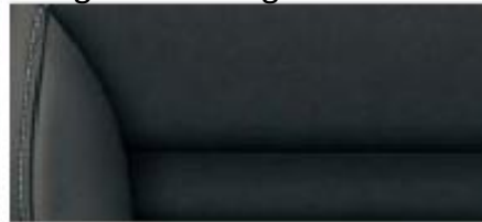
Ambition, Elegance interior* Black Alcantara/leather/artificial leather