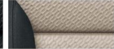
Elegance interior – Yeti Outdoor Gobi Sand fabric