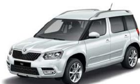
Moon White metallic