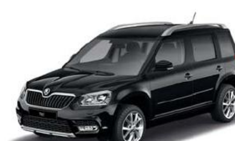
Black Magic pearl effect