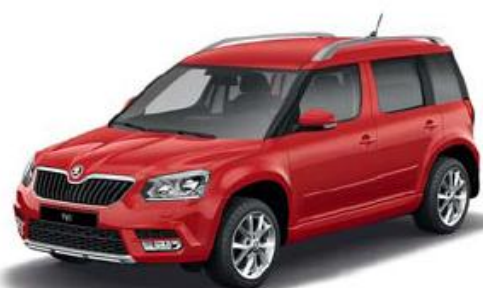
Corrida Red uni