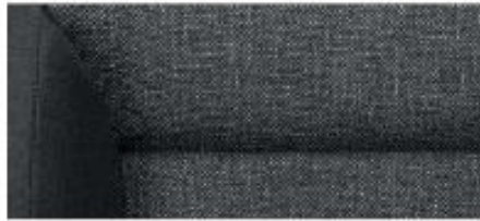
Active interior – Yeti, Yeti Outdoor Black fabric