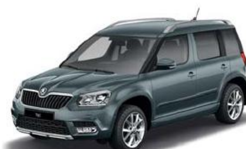
Metal Grey metallic**