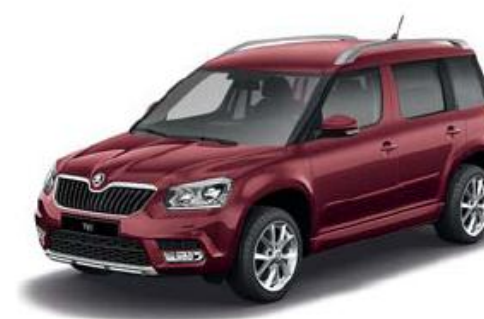
Rosso Brunello metallic