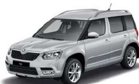
Brilliant Silver metallic