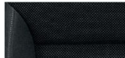
Sport interior* Silver fabric