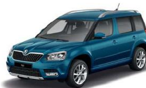
Lava Blue metallic

* vanaf maart 2014 ** vanaf januari 2014