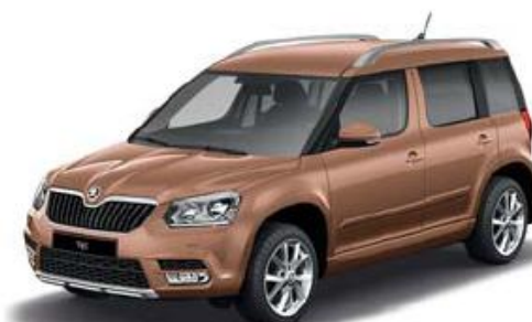
Terracotta Orange metallic