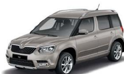
Cappuccino Beige metallic