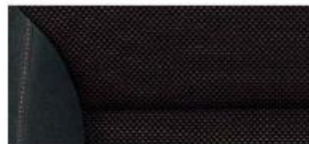
Sport interior* Red fabric