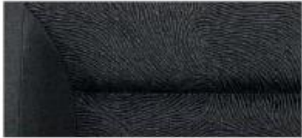
Ambition interior – Yeti Black fabric