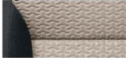
Elegance interior – Yeti Gobi Sand fabric