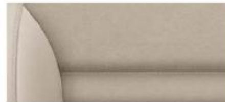
Elegance interior* Gobi Sand Alcantara/leather/artificial leather