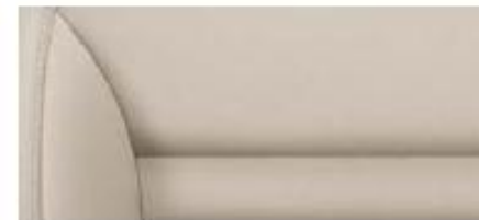
Elegance interior* Gobi Sand leather/artificial leather