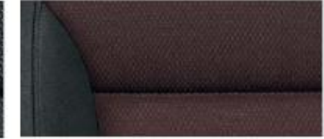
Ambition interior – Yeti Outdoor Terracotta fabric