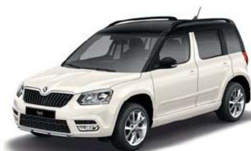
Voorbeeld: Candy White met zwart dak