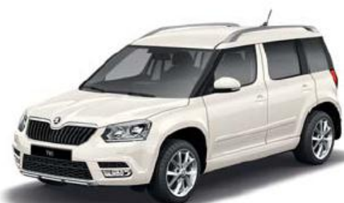
Candy White uni