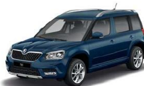
Pacific Blue uni