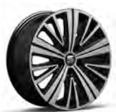
17 inch, Dynamic Brilliant Silver (PUG)