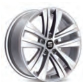
18 inch Akira Brilliant Silver (PUK)